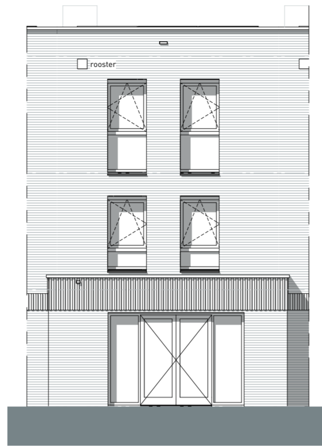
AANBOUW + 1800mm Schaal 1:100 ACHTERGEVEL - TYPE A1 Bouwnr: 91, 92, 93