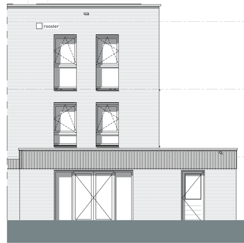
AANBOUW + 1800mm ACHTERGEVEL - TYPE A3 Bouwnr: 94