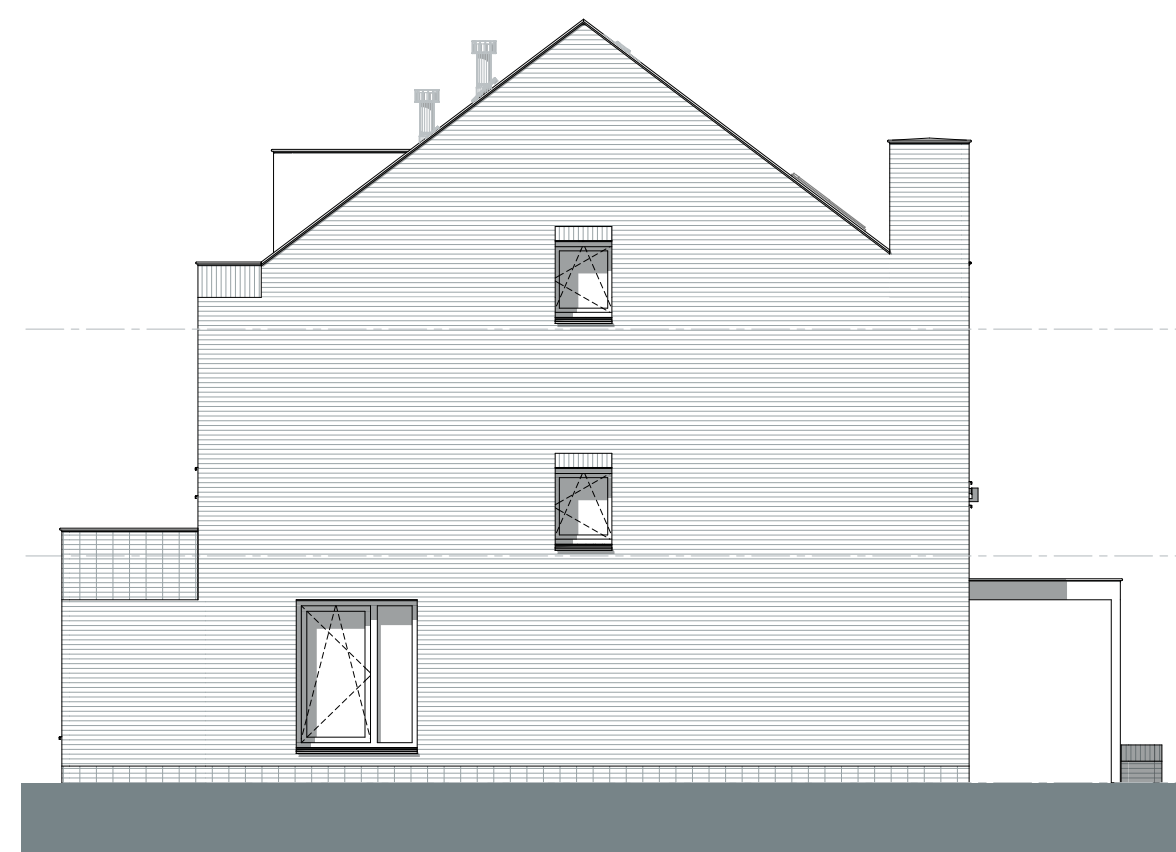
AANBOUW + 1800mm ZIJGEVEL - TYPE D2 Bouwnr: 89